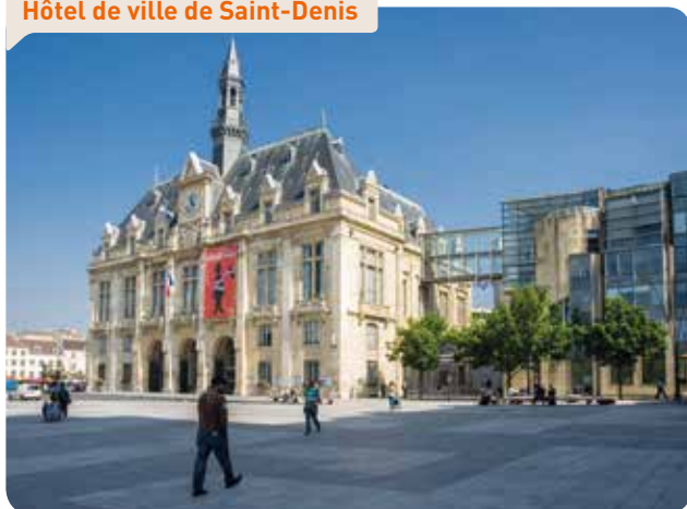
Hôtel de ville de Saint-Denis

25 000 étudiants dont 3 000 en centre-ville