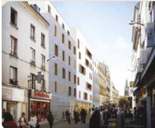
Perspective Condroyer – rue de la République