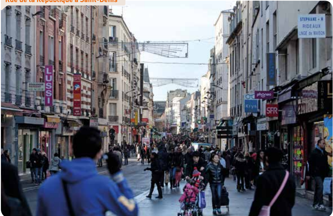
Rue de la République à Saint-Denis

La ville de Saint-Denis investit dans la sécurité de ses habitants au centre-ville grâce notamment à :